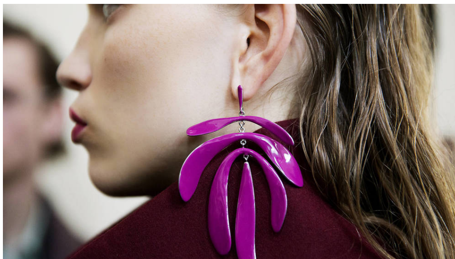
La propuesta de Ferragamo: pendiente XXL, pesado, pero ¡ideal!

Para tonificar el lóbulo, cerrar agujeros rasgados, remodelar la zona... Los procedimientos para esta zona son sencillos y no se notan. ¿O sí?