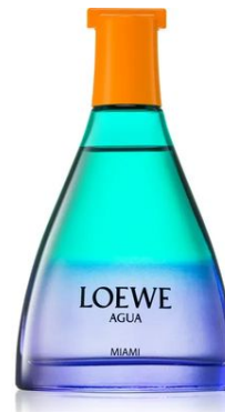
Loewe Agua de Loewe Miami eau de toilette unisex 100 ml