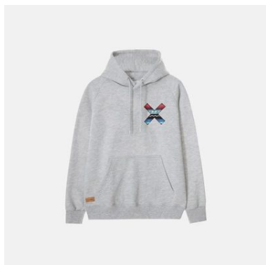
CLASSIC GREY HOODIE - L