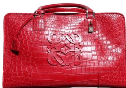
Loewe Vestiaire Collective